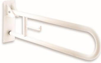
BG0800 y BG0850 Acabado blanco