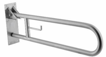
BG0800CS y BG0850CS Acabado satinado