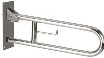
BG0800C Acabado brillante